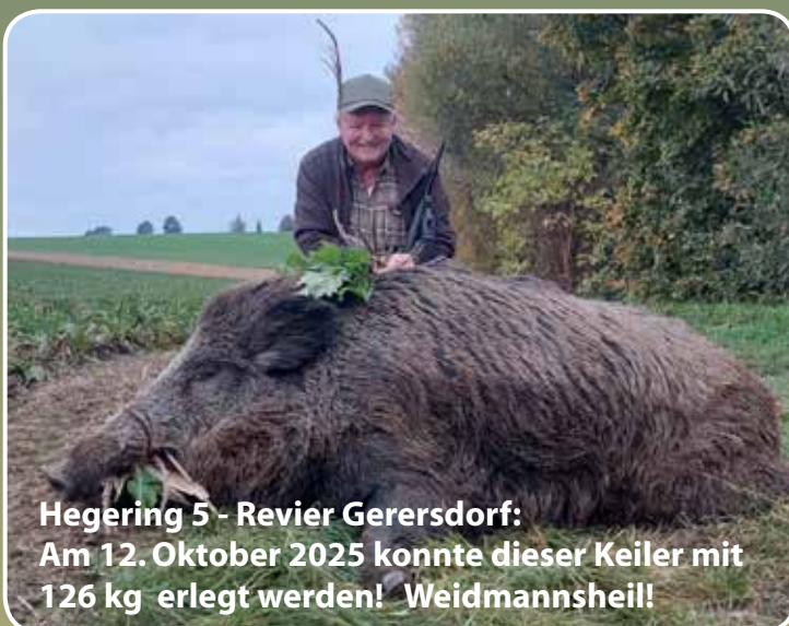
Hegering 5 - Revier Gerersdorf: Am 12. Oktober 2025 konnte dieser Keiler mit 126 kg erlegt werden! Weidmannsheil!